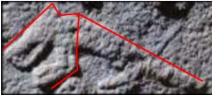
Resim 2: 2 numaralı dikilitaş, tilki motifi. Göbeklitepe. Sweatman, M.B. (2024), Fig. 12.

Ayrıca henüz hepsi anlamlandırılmasa bile resmedilen bazı hayvanların takım yıldızı ve gezegenlerin betimi oldukları da düşünülmektedir (Kurtik 2019). Göbeklitepe’de yer alan 2 numaralı dikilitaş üzerindeki tilki olduğu düşünülen hayvan kabartmasının, kova takım yıldızının kuzey kısmı ile benzerlik göstermesi bu iddiaları kuvvetlendirmektedir. Elbette ki yapılan tarih arařtırmaları ilerleyen zamanlarda bizlere daha da yol gösterici veriler sunacaktır.