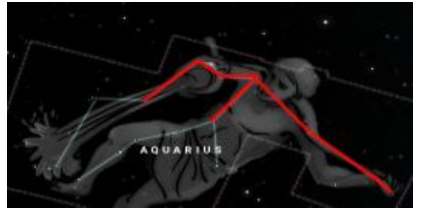
Resim 3: Kova takım yıldızı. Stellarium.

Göbeklitepe örneğinde olduğu gibi insanođlu her daim astronomi bilimini yaşamın dođal bir yol göstericisi olarak kabul etmiştir. Yıldızlara bakarak yön bulmuş, ekinoks döngülerini gözlemleyerek takvimleri oluşturmuştur. Bilgiyi doğanın kendisinden öğrenmiş, bu durum inanç sistemine de yansımıştır. İnsanođlu doğanın muntazamlığını gördükçe bunun olađanüstü bir düzen olduğunu anlamış ve arka planda yaratım gücüne sahip yüce bir varlık olmalı diye düşünmüştür. Dini inancı, doğanın kendisinden öğrenmiş, gördüğü majör olayların altında tanrısal etkilerin olduğunu düşünerek inancını hikayeleştirmiştir.